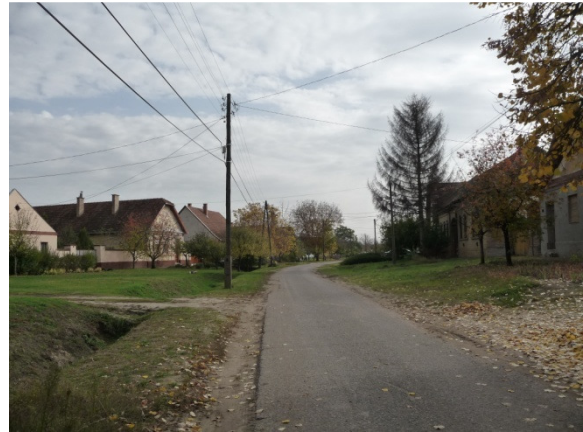
Széles utcák egy, illetve két kocsiúttal, középen vízvezető csatornával.