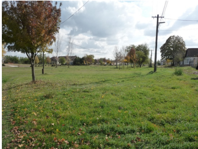
Egy köz, valamint az egykor legelőként használt Széchenyi utca a Gányóban.

A községben különleges adottságot jelentő, még sokáig hálós halászatot is biztosító – szintén északnyugat-délkeleti irányban elnyúló - Nagytó alsó végénél húzódott a falu széle még a 19. század végén is. Tőle tovább délkeleti irányban hosszú, keskeny sávban – egészen a II. világháborúig az Alsó-szőlők , majd bővítve, még tovább az Új-szőlők húzódtak. A területre közhasználatos Gányó név viszont dohánytermesztésre utal. A községtől északkeletre is szőlőként műveltek a kezdetektől egy szabályos, zömök téglalap alakú területet, amely a 19. század végén a Józsan-begy (!) névre hallgatva apró parcellákra osztva szolgálta a lakosokat.